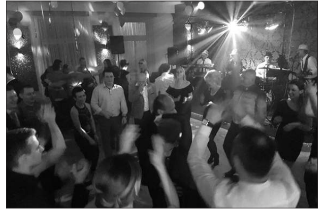
Hutnicza Solidarność '80 zorganizowała dla swoich członków i sympatyków zabawę sylwestrową w częstochowskiej restauracji Lea. Przy muzyce na żywo bawiono się do rana.