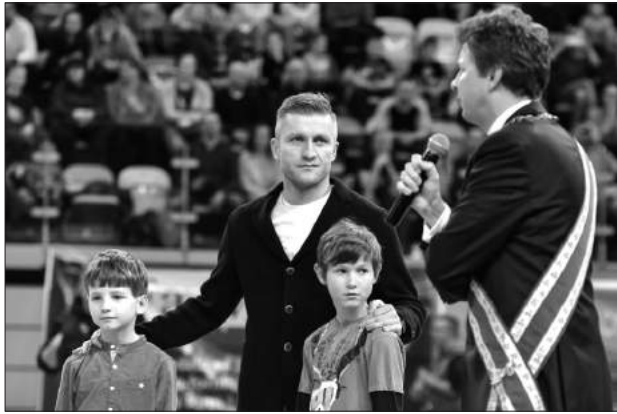
Reprezentacyjny piłkarz Jakub Błaszczykowski za działalność na rzecz dzieci otrzymał Order Uśmiechu. Uroczystość odbyła się w Hali Sportowej Częstochowa, a towarzyszył jej turniej piłkarski.