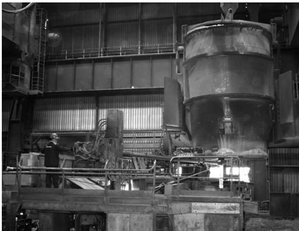
Największa liczba nowych pracowników będzie mogła znaleźć zatrudnienie na terenie Stalowni.

“Wyrażam zgodę na wykorzystanie i przetwarzanie przez firmę GI Group Sp. z o.o. z siedzibą w Katowicach, ul. Sobieskiego 11, danych osobowych do celów związanych z procesem rekrutacji oraz udostępnienie tych danych ISD Hucie Częstochowa Sp. z o.o., w ramach prowadzonych procesów rekrutacji, zgodnie z Ustawą z dnia 29.08.1997r (Dz. U. z 2002 r. Nr 101, poz. 926 ze zm.) o Ochronie Danych Osobowych. Przysługuje mi prawo dostępu do moich danych, ich poprawiania oraz usunięcia.”