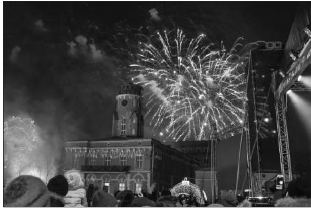
Zgodnie z tradycją wielu częstochowian powitało Nowy Rok podczas imprezy na Placu Biegańskiego. Zobaczyli efektowny pokaz pirotechniczny i wysłuchali koncertu grupy Blue Cafe.