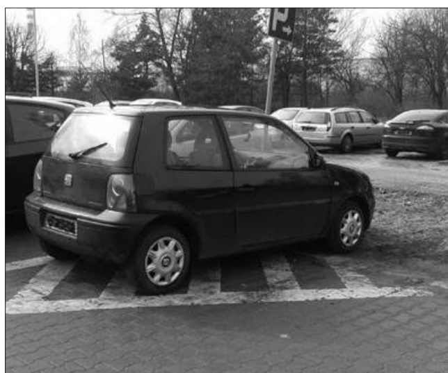
Pracownicy Działu BHP dokumentują przypadki złego parkowania.

– Nie chcemy karać pracowników, ale będziemy dokumentować takie przypadki i zwracać uwagę kierowcom, żeby wzięli sobie to do serca – podkreśla Zbigniew Słomka. Pracownicy Działu BHP i Ochrony Środowiska zrobili już serię zdjęć, na których widać liczne niewłaściwie zaparkowane samochody. Dwie z tych fotografii publikujemy obok. N