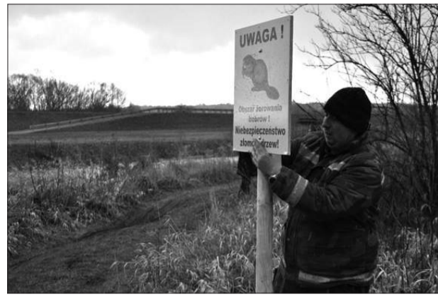
Boby tak rozprzestrzeniły się w Częstochowie, że władze miasta ustawiły wzdłuż Warty tablice ostrzegające przed zagrożeniem przewrócenia się drzew nadgryzionych przez te zwierzęta.