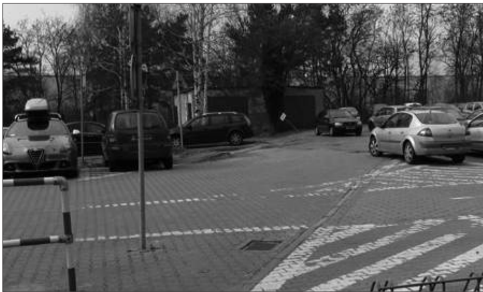
Najczęstsze błędy to pozostawianie aut na wysepkach lub w ten sposób, że zawężają drogi dojazdowe.