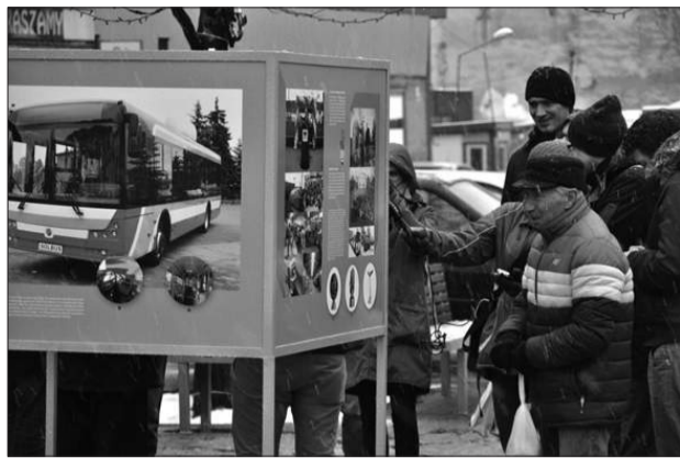
Do końca marca na tzw. Kwadratach przy DH Megasam można oglądać wystawę fotografii przygotowaną z okazji 65-lecia Miejskiego Przedsiębiorstwa Komunikacyjnego w Częstochowie.