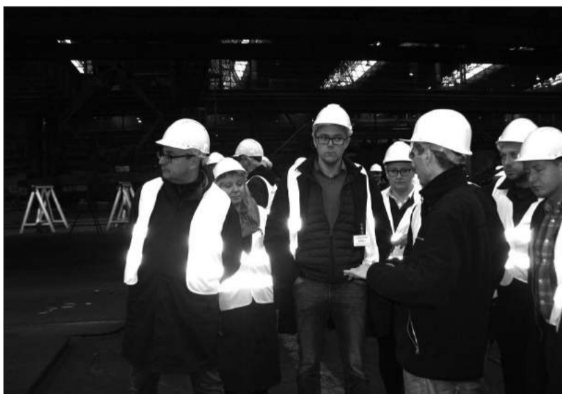
Handlowcy i zaopatrzeniowcy z ThyssenKrupp Energostal S.A. podczas szkolenia mieli okazję zwiedzić Stalownię oraz Walcownię Blach Grubych ISD Huty Częstochowa.

ISD Huta Częstochowa zorganizowała szkolenie połączone z zwiedzaniem Stalowni i WBG dla przedstawicieli handlowych firmy ThyssenKrupp Energostal S.A. z całej Polski.