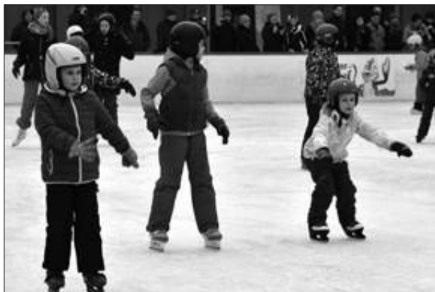
W ubiegłą sobotę rozpoczął się sezon na Sztucznym Lodowisku przy ul. Boya-Żeleńskiego 6/8. Jest ono czynne codziennie w godz. 10 - 20. Wkrótce będzie też ślizgawka na Starym Rynku.