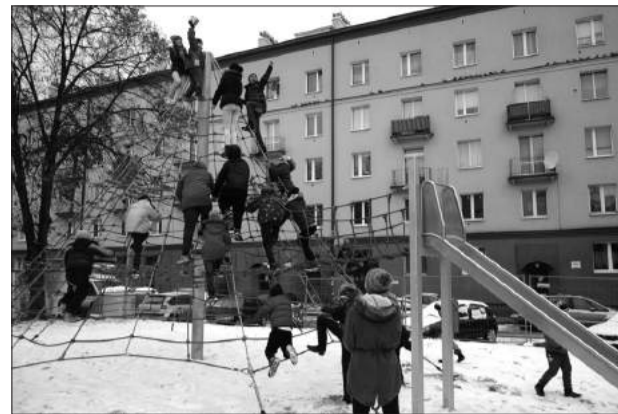
Nowy plac zabaw dla dzieci, którego atrakcje to m.in. huśtawki, jeżdźalnica i sześciometrowa piramida z lin, zbudowany przez miasto kosztem 115 tys. zł, otwarto we wtorek przy Alei Pokoju.