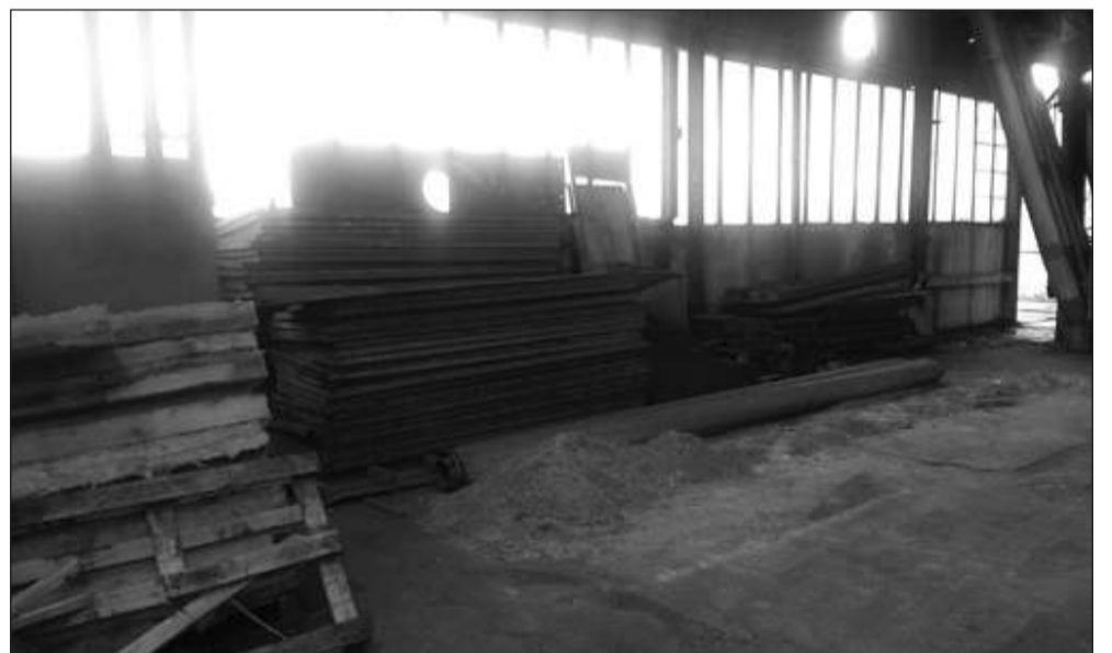
Przed wdrożeniem zasad 5S wzdłuż ścian zalegało mnóstwo zbędnych przedmiotów i odpadów.

równocześnie systemu TPM (dotyczy właściwego wykorzystania i utrzymania maszyn i urządzeń) jest tzw. zarządzanie wizualne. W hali gdzie wprowadzono zasady 5S wiszą specjalne tablice, które są punktami informacyjnymi, zawierającymi instrukcje obsługi, harmonogramy działań, wyniki audytów itp. Tam też odpowiedzialni za konkretne zadania pracownicy podpisem potwierdzają ich wykonanie, zgodnie z przyjętymi standardami. Dotyczy to także utrzymania porządku w halach. A trzeba to robić stale, choćby dlatego, że w hali wciąż się kurzy.