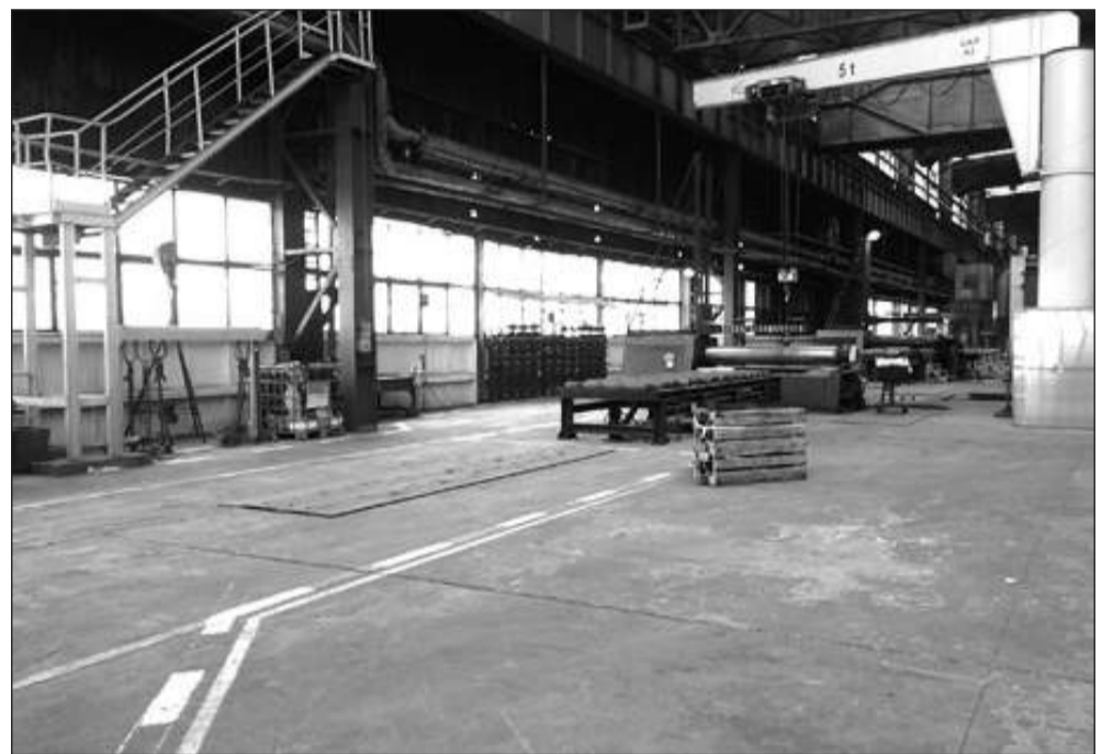
Uporządkowana hala III wsadowa Walcowni Blach Grubych z namalowanymi liniami, wyznaczającymi ciągi komunikacyjne oraz wyznaczonymi polami roboczym, może być wzorem dla innym w Hucie.

Istotnym elementem 5S, podobnie jak wdrażanego