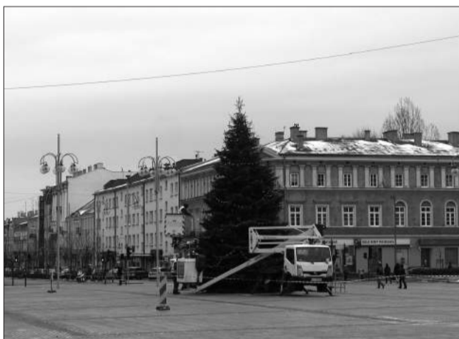
W poniedziałek na pl. Biegańskiego ustawiono 11-metrowy świerk.

Wszyscy, którzy przyjdą na plac Biegańskiego, będą mogli m.in. spotkać się ze Świętym Mikołajem, otrzymać