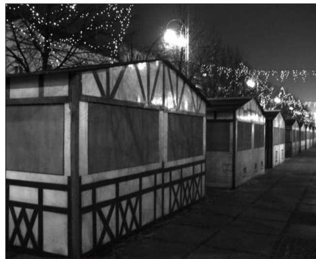
Już w środę wieczorem w Alejach ustawiono budki dla sprzedawców.

Harcerze przekażą wszystkim chętnym Betlejemskie Światło Pokoju. Wielkie Betlejemskie Ogniobranie odbędzie się 20 grudnia, o godz. 18 na Placu Biegańskiego. Organizatorem „Gwiazdkowej Alei” jest Częstochowska Organizacja Turystyczna. N