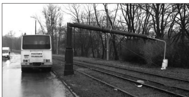
Zniszczona latarnia w Al. Pokoju między Rondem Reagana a pętlą.

Prawdopodobnie nie pojedą one tam także w piątek (zastąpią je autobusy), bo oprócz naprawy trakcji konieczne jest również usunięcie szczątków zniszczonej latarni. N