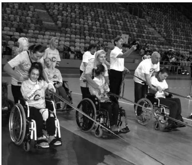
W kilku konkurencjach niepełnosprawnym pomagali opiekunowie.

Od lat ISD Huta Częstochowa oraz Miejski Ośrodek Sportu i Rekreacji podobne zawody sportowe dla niepełnosprawnych organizują dwa razy w roku: wiosną na stadionie, a jesienią w hali. N