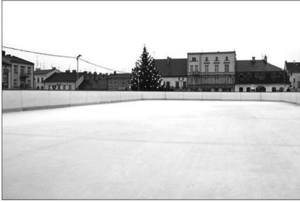
W czwartek oficjalnie zainaugurowała działalność bezpłatna miejska ślizgawka. W tym roku została ulokowana na Starym Rynku. O ile pozwoli pogoda, ma funkcjonować do marca.