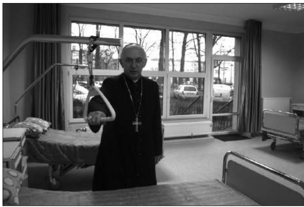
W Częstochowie powstały dwa pierwsze Dzielne Domy Seniora Wigor – przy ul. Rapackiego (prowadzony przez Archidiecezjalny Caritas) i ul. Marysia (Polski Komitet Pomocy Społecznej).