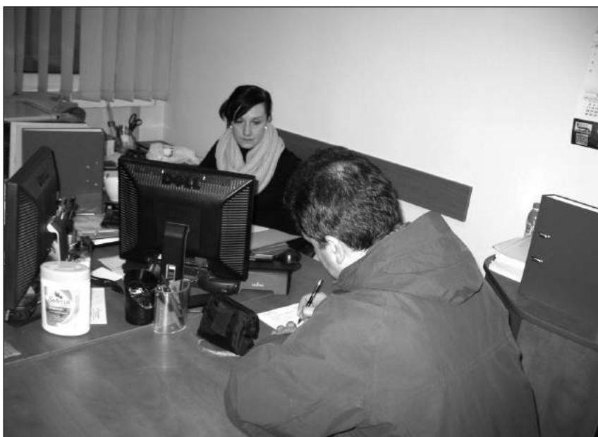
Zapisy na dofinansowania prowadzi Renata Mielczarska z Działu Pracowniczego.

N Szczegółowy harmonogram zapisów – strona 3.